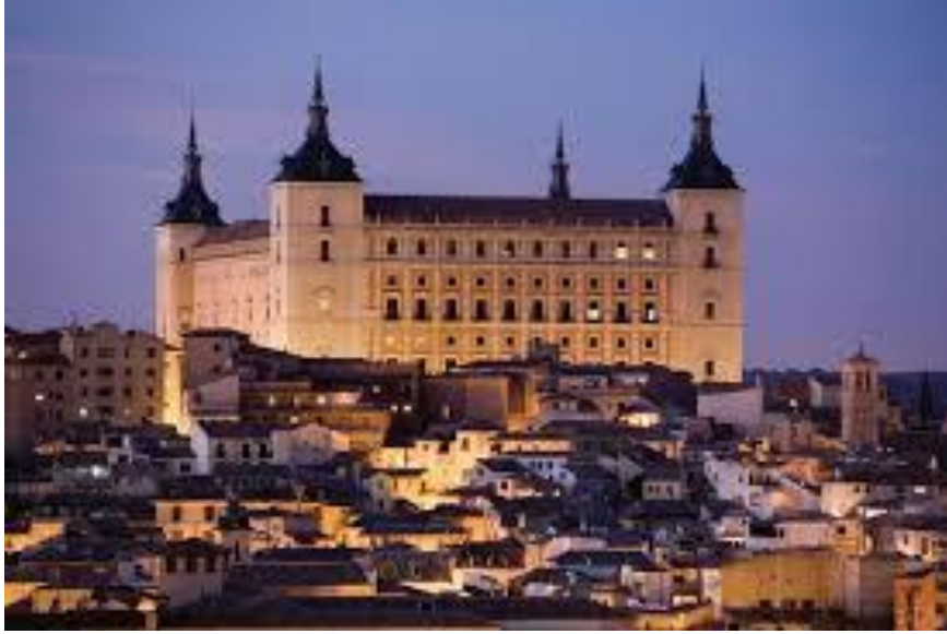
Toledo – Alzazar - Historical Fortress