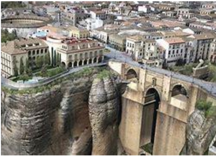
Ciudad de Ronda

Ronda está construida en la cima de una colina, en una hendidura de piedra caliza escarpada. Debido a esto, las vistas son espectaculares y vigorizantes. Alrededor de la ciudad hay restos de asentamientos prehistóricos que datan del Neolítico, incluidas las pinturas rupestres de la Cueva de la Pileta. Ronda fue colonizada por primera vez por los celtas, que la llamaron Arunda en el siglo VI a.C. La actual Ronda es de origen romano, habiendo sido fundada como puesto fortificado en la Segunda Guerra Púnica por Escipión el Africano. Ronda recibió el título de ciudad en la época de Julio César. Cena con vino en nuestro hotel. Alojamiento en Costa del Sol.