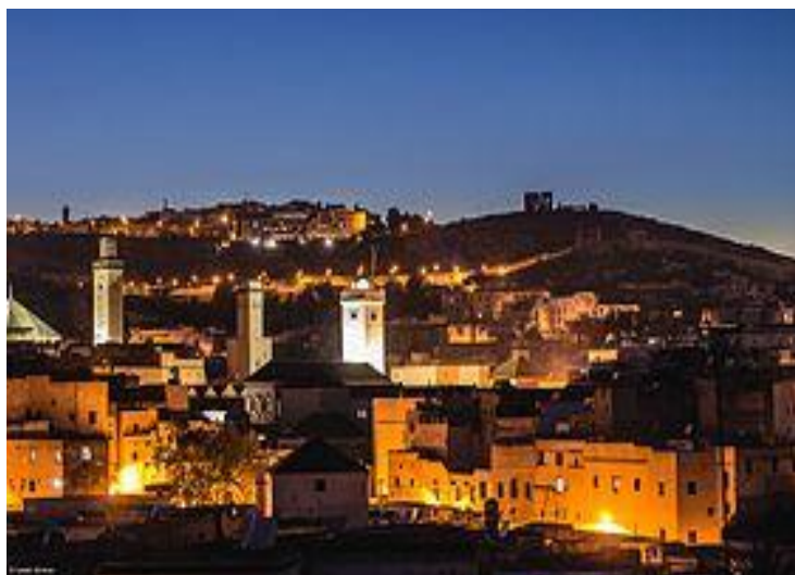
Fez- Medina Fez-el-Bali

Desayuno buffet y visita de la primera de las ciudades imperiales. Fez es la capital intelectual y religiosa de Marruecos. Comenzaremos con un recorrido panorámico desde el hotel para conocer el palacio real y sus siete puertas o Dar al-Makhzen de camino al fascinante mundo de la Medina de Fez el Bali, la más antigua y extensa de Marruecos patrimonio de la humanidad por la UNESCO con 785 mezquitas y más de 2.000 plazas, calles y callejuelas que suponen un laberíntico interesante. Regresando en el tiempo desde Bab Boujloud hasta la Plaza Esseffarine realizaremos un viaje a través de los siglos comenzando en el siglo IX hasta el XIX. A lo largo del paseo conoceremos como se estructuran estas callejuelas, y las diferentes construcciones que componen los muros de la Medina, además de sus gremios de artesanos y barrios como el de los curtidores de pieles o costureros, para ver sus antiguas formas de trabajo. Conoceremos una medersa (escuela o centro de estudios en el mundo islámico) y finalizaremos al son del martillo de los alfareros trabajando el cobre tal como lo hacían hace cientos de años. Almuerzo (libre) en un restaurante típico, dentro de la medina y tarde libre para recorrer la ciudad. Cena en nuestro hotel. Alojamiento en Fez.