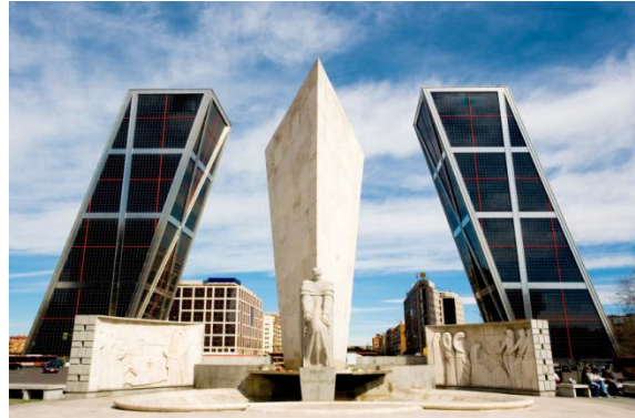
Madrid Distrito Financiero

Madrid es una ciudad caracterizada por una intensa actividad cultural y artística y remonta sus orígenes al año 882 AC y cuenta con museos y monumentos de extraordinaria belleza. Por la tarde, nos dirigiremos a la ciudad de Toledo , caminando por el antiguo barrio judío antes de visitar la Sinagoga de Santa María la Blanca, la sinagoga más antigua de Europa aún en pie. La siguiente es la Iglesia de Santo Tomé, con sus magníficas obras maestras de El Greco.