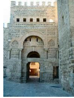
Ancient city door