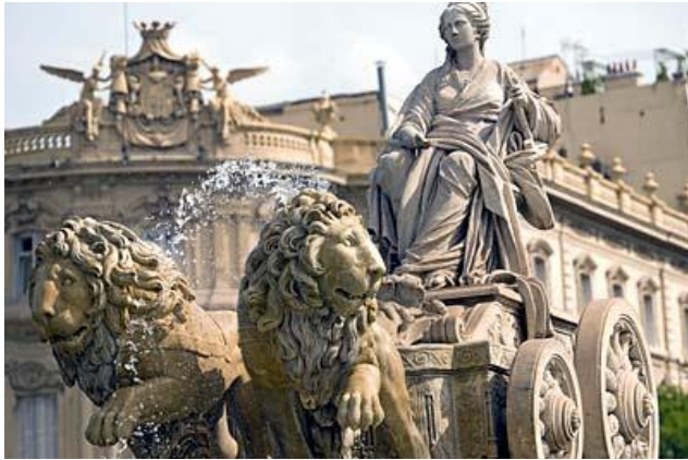
Madrid – Fuente de Cibeles

Después de un abundante desayuno buffet, tendremos a una visita guiada por la mañana por Madrid que incluye un recorrido panorámico completo a través de la Avenida Mayor, la Puerta del Sol, la Plaza del Parlamento y una parada fotográfica fuera del Palacio Real.