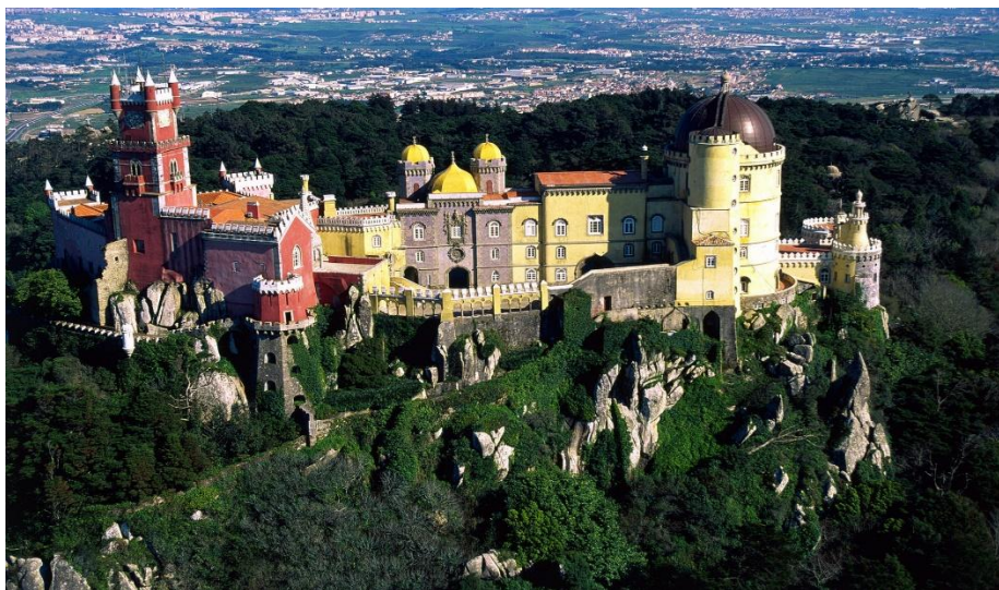
Castillo de Pena en Sintra