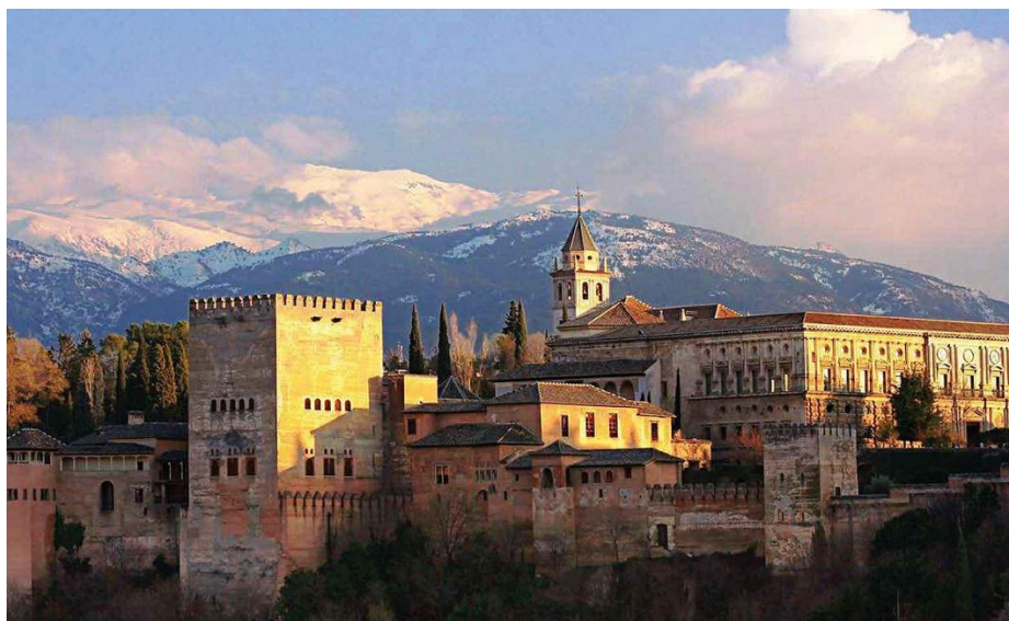
El palacio de la Alhambra en Granada